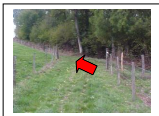
26 – Suivre le chemin qui monte à gauche