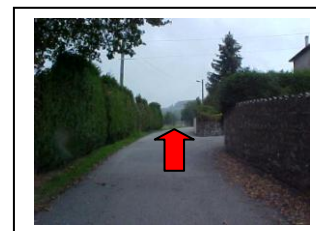
28 – Continuer tout droit