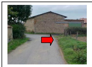
17 - Longer la ferme à droite