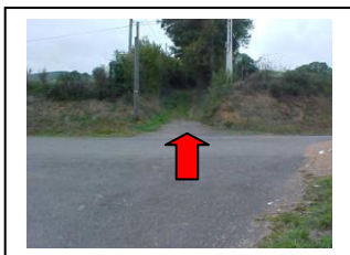
21 - Traverser prudemment la route