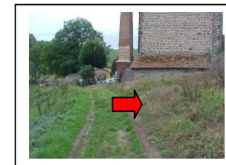
20 - Suivre le sentier qui part à droite