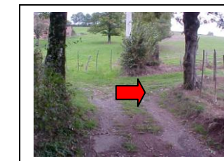
25 – Suivre le chemin à droite à travers prés