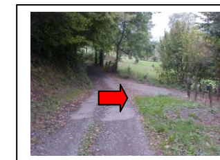
24 – Suivre le chemin à droite