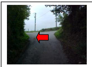
16) Suivre la route à gauche