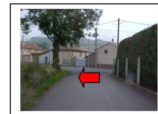
29 – Longer la route à gauche - ARRIVEE