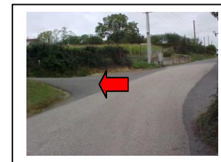
19 - Tourner à gauche en descente