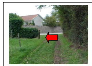
27 – Partir à gauche sur la route