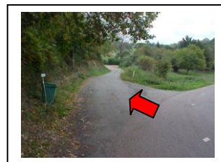
23 – Partir à gauche