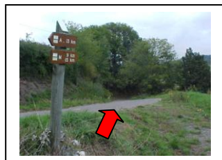
22 – Suivre la route à droite