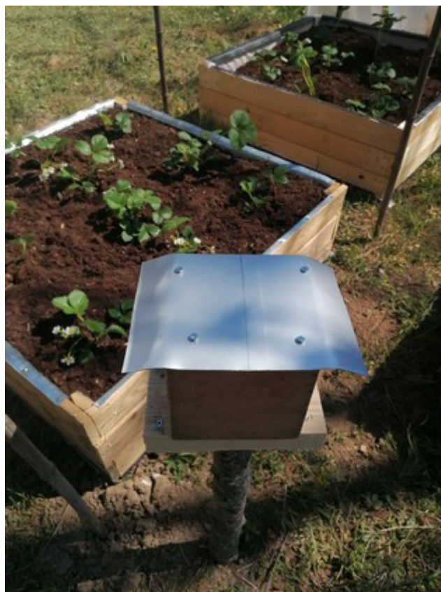
vue de dos